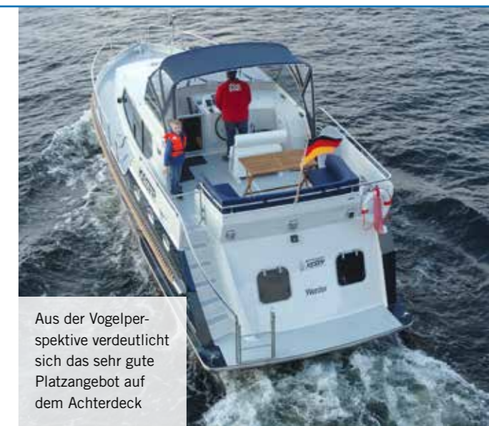
Aus der Vogelperspektive verdeutlicht sich das sehr gute Platzangebot auf dem Achterdeck

WEITERE INFORMATIONEN UND BUCHUNG Bootscharter Keser An der Havel 38 14542 Werder an der Havel, OT Töplitz Tel. 030-3620800 www.bootscharterkeser.de